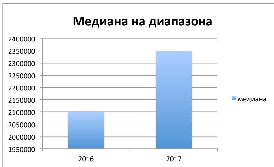
Фиг. 2: Развитие на недоволството. Медианата е средната точка между минимума и максимум на броя гласоподаватели, потенциално противници на статуквото.

Изкушени сме - макар засега разчитайки само на две точки, както и по-горе - да построим и графика на потенциалния обхват на “мълчаливото морално мнозинство”. На Фиг. 2 са представени медианите на теоретичните диапазони както са изчислени в т. 6 по-горе и т. 6 в /8/. Като цифров израз тези диапазони в първо приближение са съответно 600 000 - 3 600 000 за изборите през 2016 г., и 700 000 - 4 000 000 за тези през 2017 г. Медианите са респективно 2 100 000 и 2 350 000, и това е показано на фигурата, за по-лесно визуализиране. Ще продължаваме да следим развитието на тези параметри, още повече, че - както вече се декларира по-горе - избори се очертава да има все по-често. Надяваме се, че - така визуализирана - тенденцията на нарастване на масата от недоволни българи, която наричаме “мълчаливото морално мнозинство”, ще поотвори очите на поне част от него, ще го стимулира да се активизира, така че то да престане да бъде мълчаливо, да излезе от черупката си и да се присъедини към революцията.